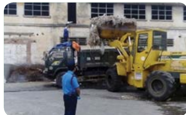
Kiểm tra hàng phế thải