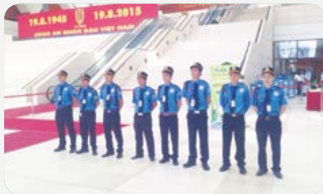
Bảo vệ sự kiện tại Trung tâm Hội nghị Quốc Gia