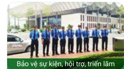
Bảo vệ sự kiện, hội trợ, triển lãm