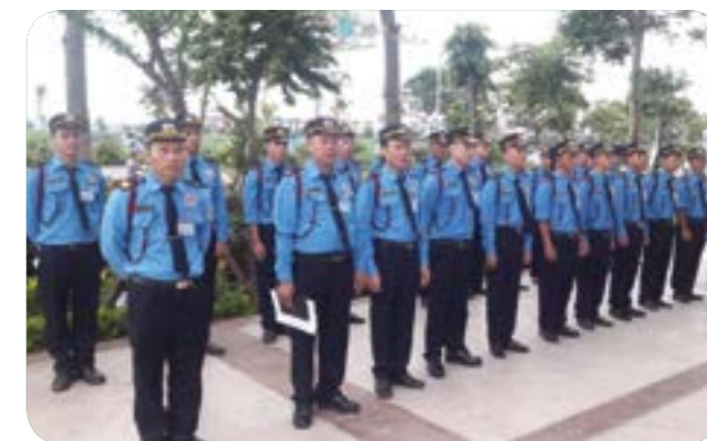
Nhận bàn giao