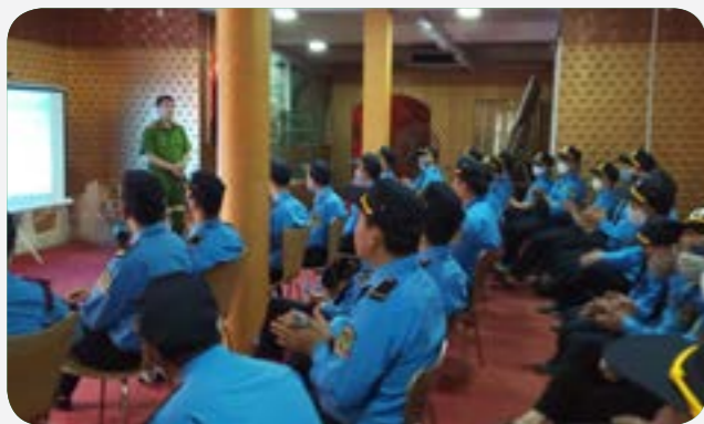
Tập huấn nghiệp vụ thường xuyên