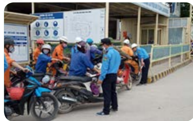
Kiểm tra cán bộ công nhân ra