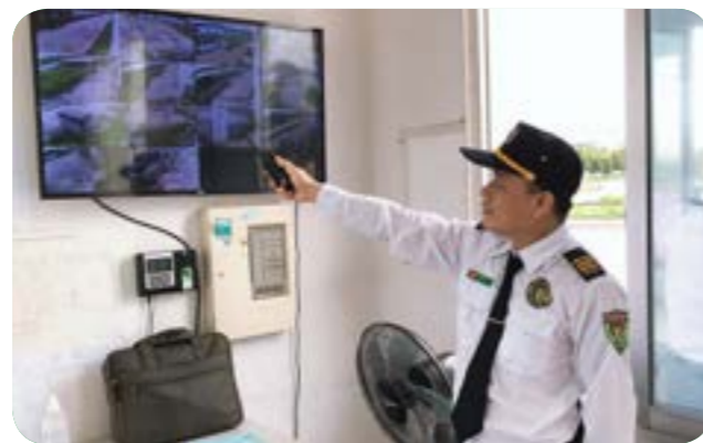
Triển khai mục tiêu mới