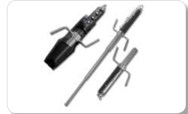
Dùi cui sắt, cao su, gậy gỗ