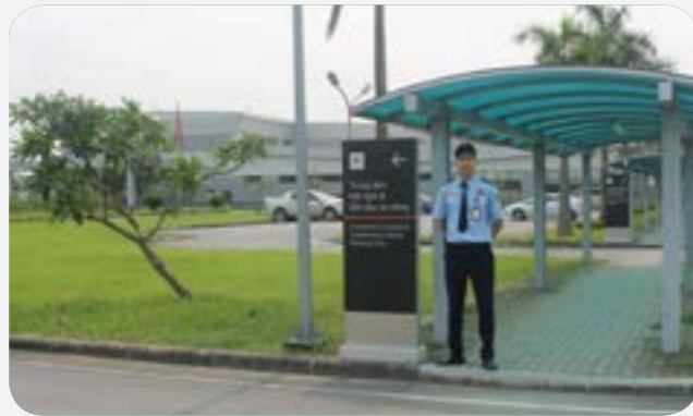
Nhân viên trực tại trụ sở Công ty CP Kenvin