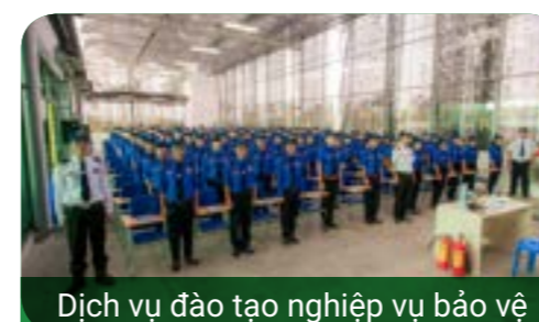
Dịch vụ đào tạo nghiệp vụ bảo vệ