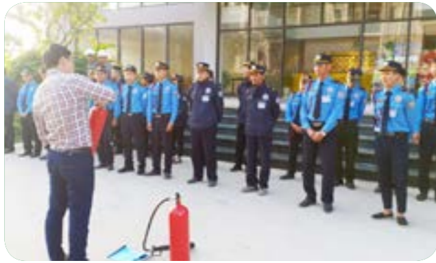
Huấn luyện công tác PCCC tại Mục tiêu