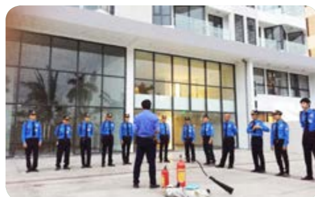
Đào Tạo phòng cháy