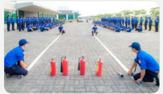
Tiếp nhận bảo vệ mục tiêu nhà máy gỗ Thành Nam