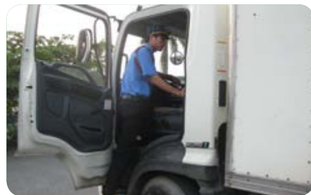
Kiểm tra hàng nhập khẩu