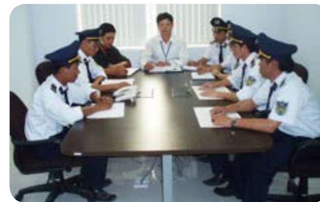
Triển khai mục tiêu bảo vệ