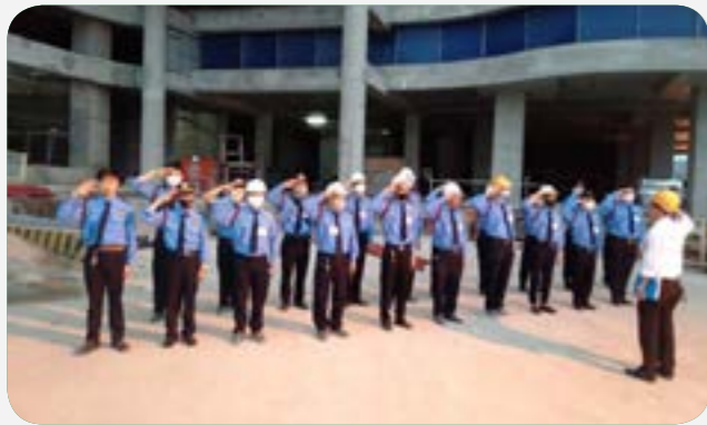
Đào tạo tác phong điều lệnh