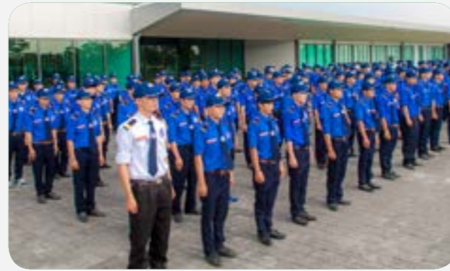
Kiểm tra tác phong nhân viên