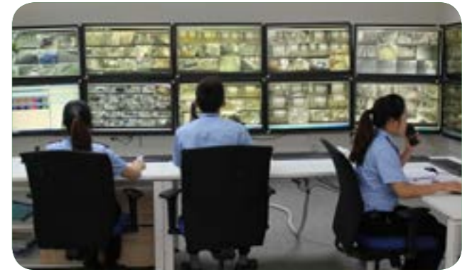
Theo dõi phòng giám sát camera