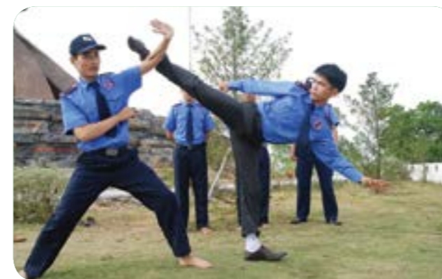
Huấn luyện võ thuật