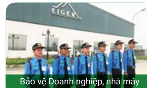
Bảo vệ Doanh nghiệp, nhà máy