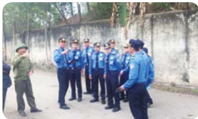
Triển khai bảo vệ nhà máy Giấy Hoàng Văn Thụ