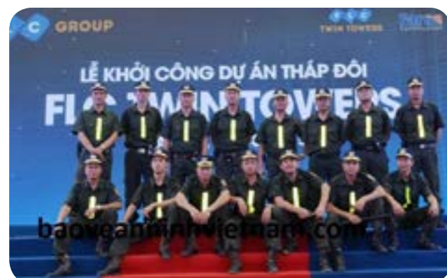
Bảo vệ sự kiện