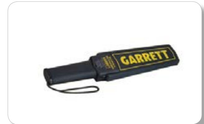
Máy dò kim loại