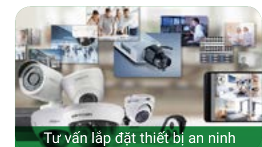
Tư vấn lắp đặt thiết bị an ninh