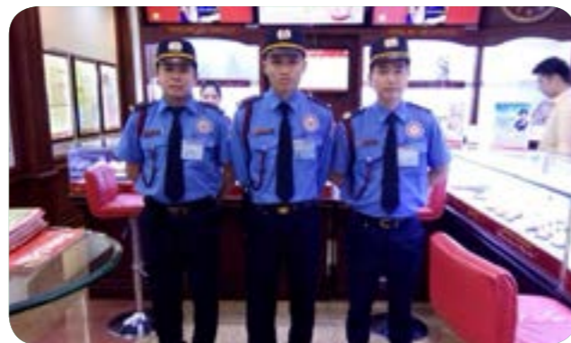
Bảo vệ hệ thống cửa hàng vàng bạc Bảo tín Minh Châu