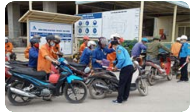
Kiểm tra công nhân