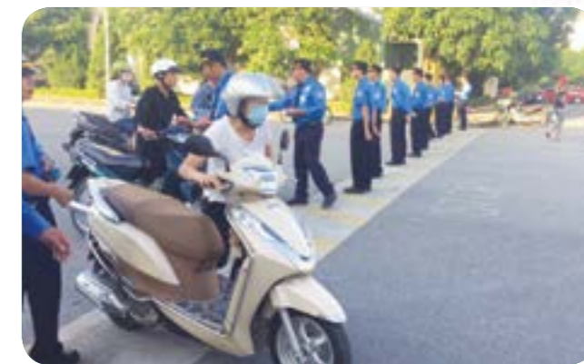
Công nhân vào