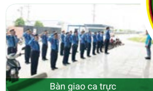
Bàn giao ca trực