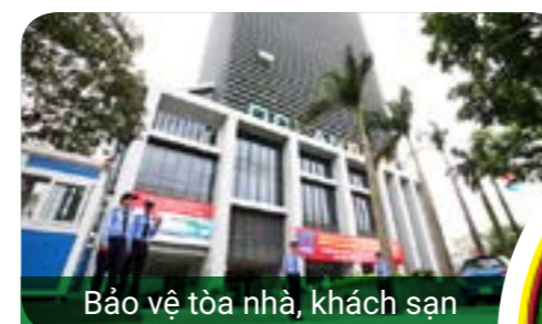
Bảo vệ tòa nhà, khách sạn