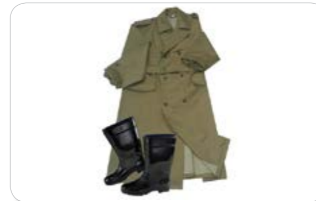
Áo mưa, Ủng