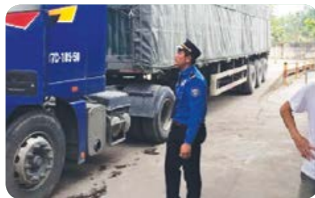
Kiểm tra hàng xuất nhập