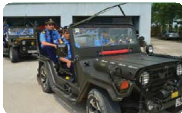
Đội cơ động lên kiểm tra các mục tiêu