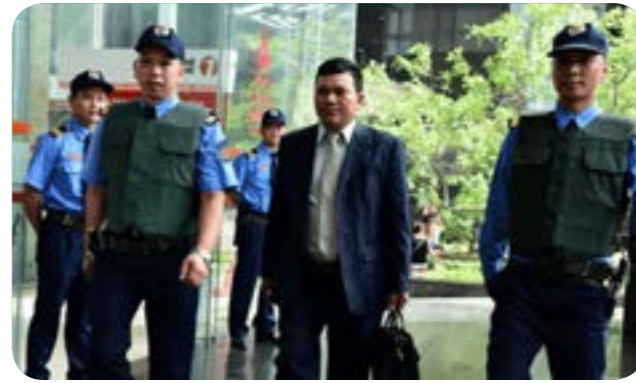
Bảo vệ Yếu nhân