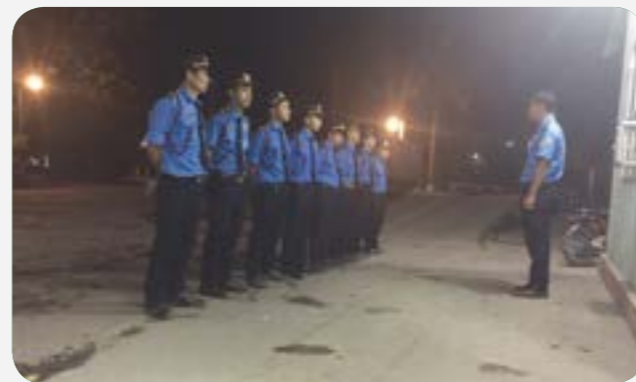
Chuẩn bị công tác bàn giao ca