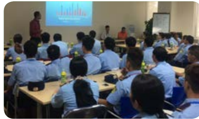
Tập huấn nghiệp vụ