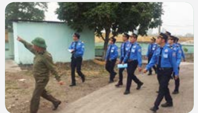
Tuần tra trong mục tiêu