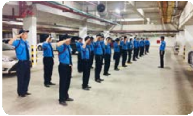
Chuẩn bị công tác tiếp nhận mục tiêu