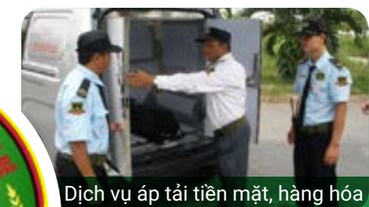
Dịch vụ áp tải tiền mặt, hàng hóa